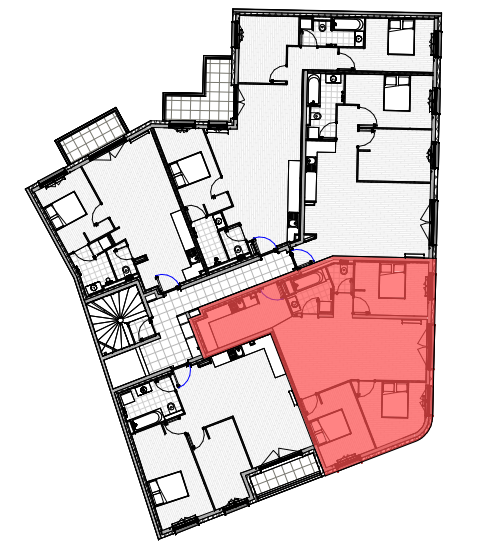
Tableau des surfaces - Lot 104