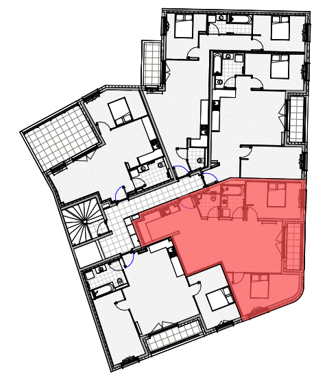
Tableau des surfaces - Lot 304