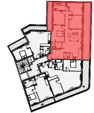
Tableau des surfaces - Lot 402