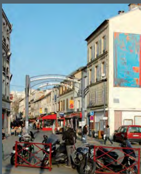
Rue du Capitaine Dreyfus