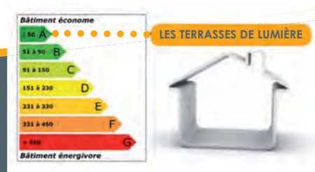
Consommation énergétique en kWh/m²/an en énergie primaire

Le recours à des technologies haut de gamme et novatrices fait de ces appartements des espaces à vivre confortables et extrêmement économes.