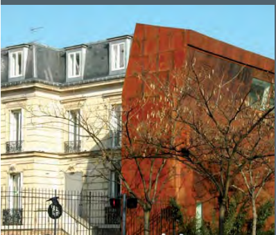
Le 116, centre d'art contemporain