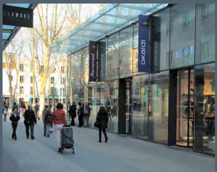
Espace commercial Grand Angle